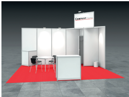
Beispiel: 20qm Kopfstand