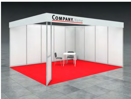
Beispiel: 20qm Eckstand