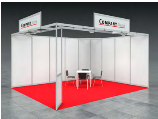
Beispiel: 20qm Reihenstand