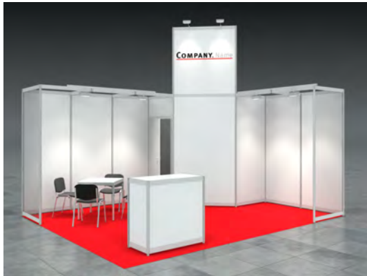
Beispiel: 20qm Eckstand

Wir bestellen den Mietmessestand HARRY entsprechend unserer Standgröße.