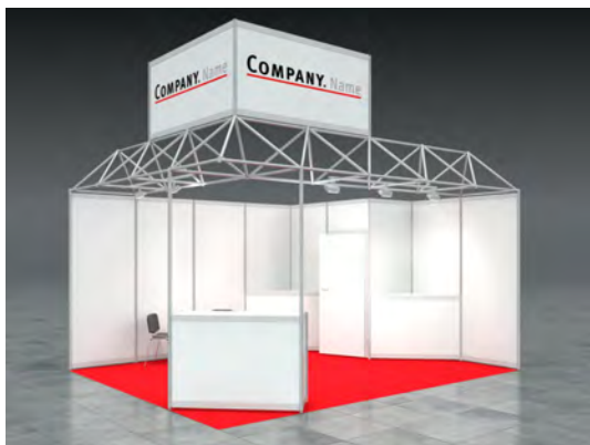
Beispiel: 20qm Eckstand