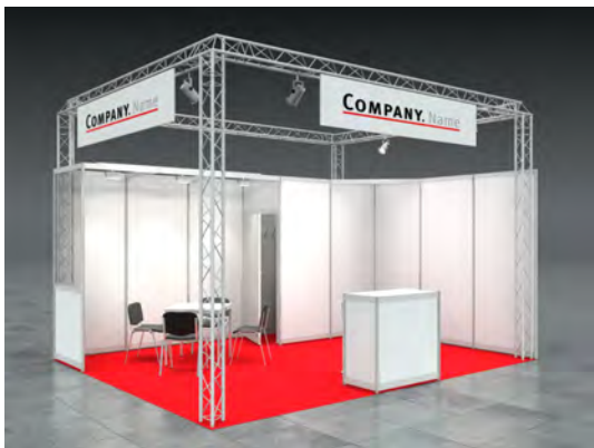
Beispiel: 20qm Eckstand

Wir bestellen den Mietmessestand DONNA entsprechend unserer Standgröße.