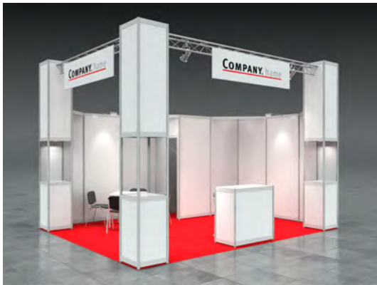
Beispiel: 20qm Eckstand

Wir bestellen den Mietmessestand LUKE entsprechend unserer Standgröße.