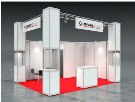
Beispiel: 20qm Eckstand