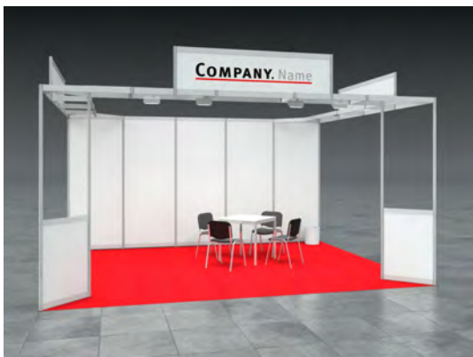
Beispiel: 20qm Reihenstand