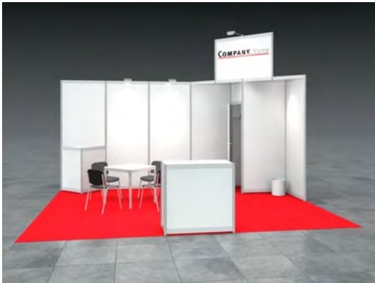
Beispiel: 20qm Kopfstand