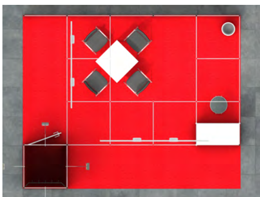
Standansicht von oben