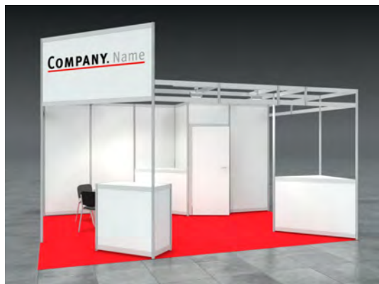
Beispiel: 20qm Kopfstand