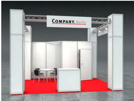
Beispiel: 20qm Kopfstand