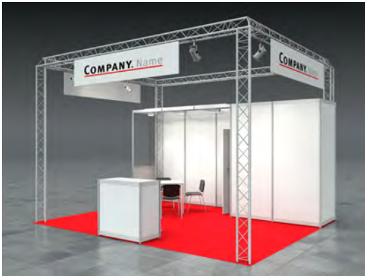
Beispiel: 20qm Kopfstand

Wir bestellen den Mietmessestand DONNA entsprechend unserer Standgröße.