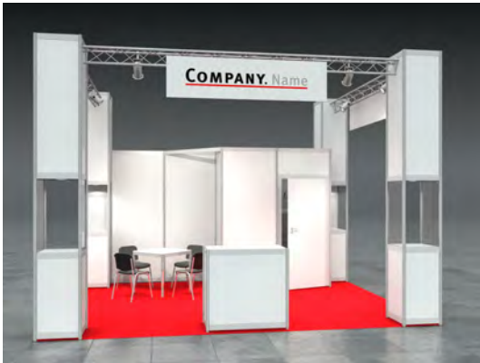
Beispiel: 20qm Kopfstand

Wir bestellen den Mietmessestand LUKE entsprechend unserer Standgröße.