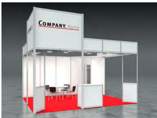
Beispiel: 20qm Kopfstand