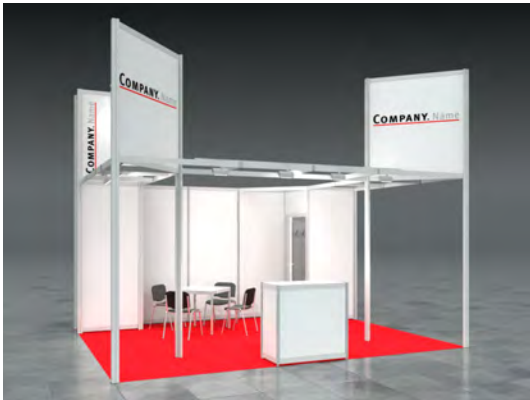
Beispiel: 20qm Kopfstand

Wir bestellen den Mietmessestand LUCY entsprechend unserer Standgröße.