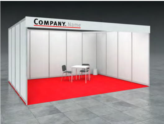
Beispiel: 20qm Eckstand