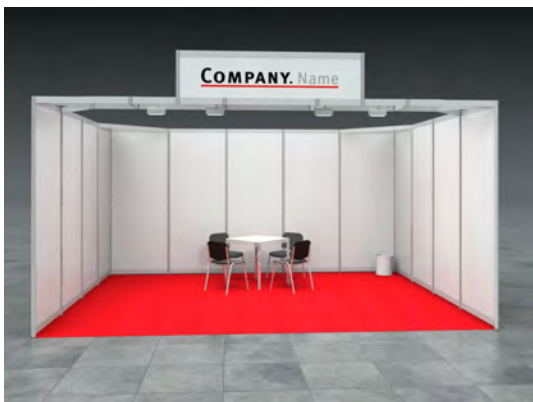
Beispiel: 20qm Reihenstand