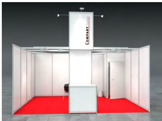
Beispiel: 20qm Reihenstand