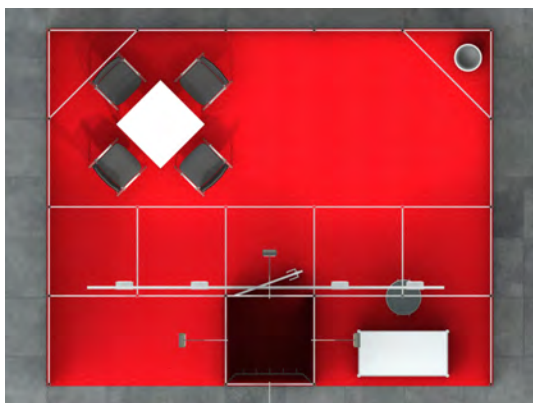
Standansicht von oben