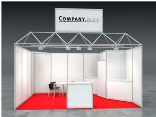
Beispiel: 20qm Reihenstand