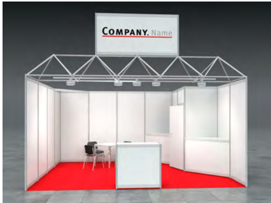
Beispiel: 20qm Eckstand