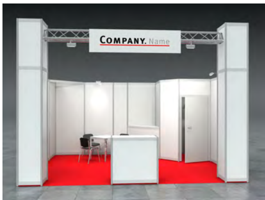
Beispiel: 20qm Eckstand