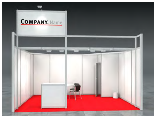
Beispiel: 20qm Reihenstand

Wir bestellen den Mietmessestand DEAN entsprechend unserer Standgröße.