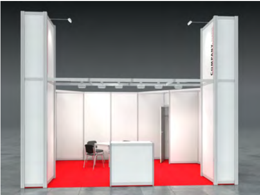
Beispiel: 20qm Eckstand

Wir bestellen den Mietmessestand LUCY entsprechend unserer Standgröße.