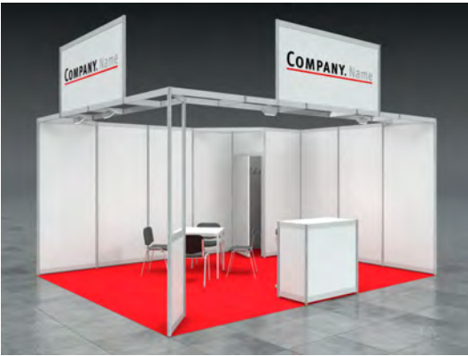
Beispiel: 20qm Reihenstand

Wir bestellen den Mietmessestand SAM entsprechend unserer Standgröße.