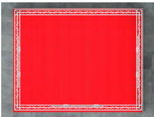
Standansicht von oben

Der Mietpreis gilt ab einer Standgröße von 20qm. Stände ab 31qm 10% Rabatt, Stände ab 51qm 20% Rabatt, Stände bis 19qm 15% Aufschlag.