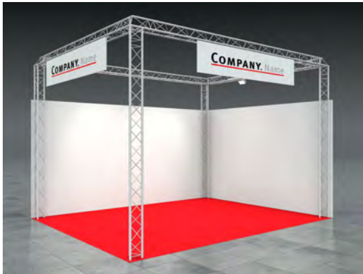
Beispiel: 20qm Eckstand

Wir bestellen den Mietmessestand ELLIE entsprechend unserer Standgröße.