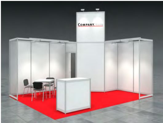
Beispiel: 20qm Eckstand

Wir bestellen den Mietmessestand HARRY entsprechend unserer Standgröße.