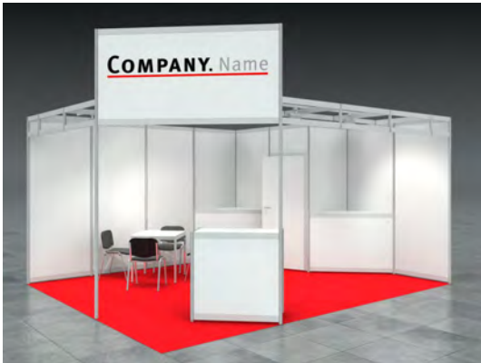
Beispiel: 20qm Eckstand

Wir bestellen den Mietmessestand LOUIS entsprechend unserer Standgröße.