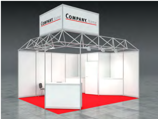
Beispiel: 20qm Eckstand

Wir bestellen den Mietmessestand SUMMER entsprechend unserer Standgröße.