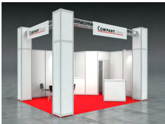
Beispiel: 20qm Eckstand

Wir bestellen den Mietmessestand DAVID entsprechend unserer Standgröße.