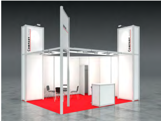
Beispiel: 20qm Eckstand

Wir bestellen den Mietmessestand LUCY entsprechend unserer Standgröße.