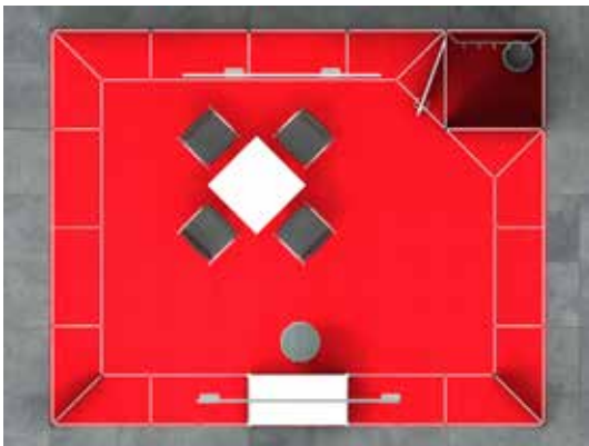
Standansicht von oben

Der Mietpreis gilt ab einer Standgröße von 20qm. Stände ab 31qm 10% Rabatt, Stände ab 51qm 20% Rabatt, Stände bis 19qm 15% Aufschlag.