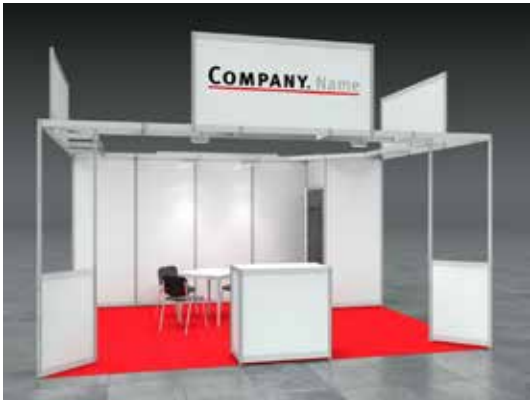
Beispiel: 20qm Reihenstand

Wir bestellen den Mietmessestand SAM entsprechend unserer Standgröße.