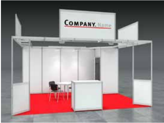
Beispiel: 20qm Reihenstand

Wir bestellen den Mietmessestand SAM entsprechend unserer Standgröße.