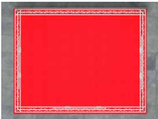
Standansicht von oben

Der Mietpreis gilt ab einer Standgröße von 20qm. Stände ab 31qm 10% Rabatt, Stände ab 51qm 20% Rabatt, Stände bis 19qm 15% Aufschlag.