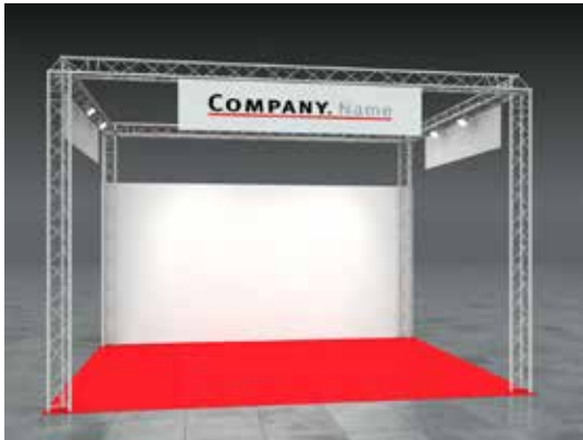
Beispiel: 20qm Eckstand

Wir bestellen den Mietmessestand ELLIE entsprechend unserer Standgröße.