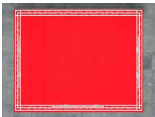
Standansicht von oben

Der Mietpreis gilt ab einer Standgröße von 20qm. Stände ab 31qm 10% Rabatt, Stände ab 51qm 20% Rabatt, Stände bis 19qm 15% Aufschlag.