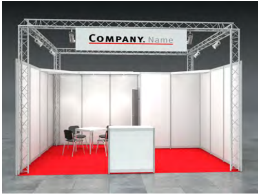
Beispiel: 20qm Eckstand

Wir bestellen den Mietmessestand DONNA entsprechend unserer Standgröße.