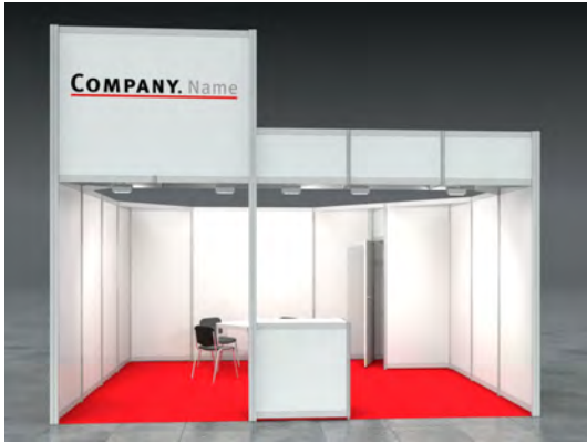
Beispiel: 20qm Eckstand

Wir bestellen den Mietmessestand JAMES entsprechend unserer Standgröße.