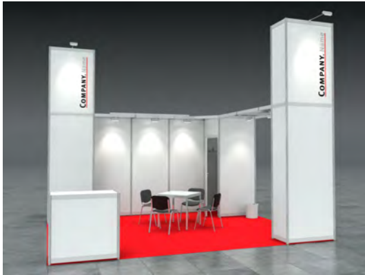
Beispiel: 20qm Kopfstand