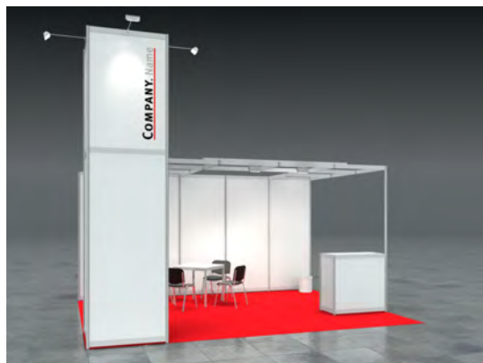
Beispiel: 20qm Kopfstand