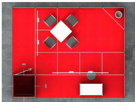
Standansicht von oben