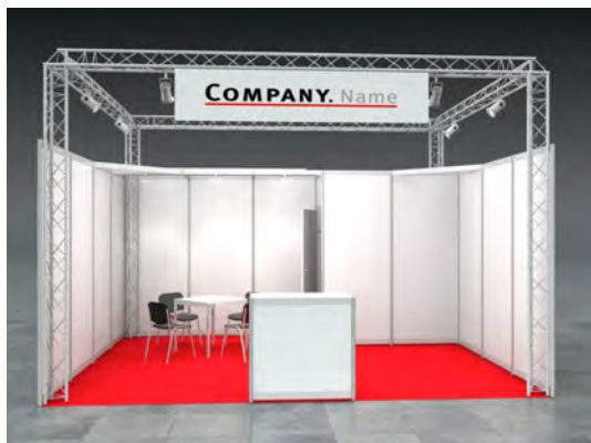
Beispiel: 20qm Reihenstand