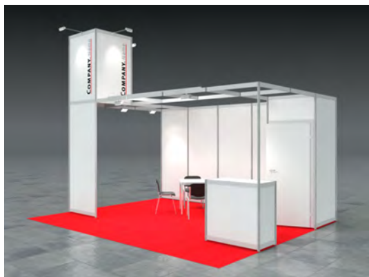
Beispiel: 20qm Kopfstand