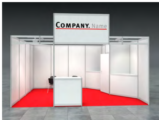
Beispiel: 20qm Reihenstand