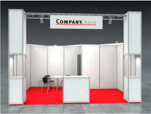
Beispiel: 20qm Eckstand

Wir bestellen den Mietmessestand LUKE entsprechend unserer Standgröße.