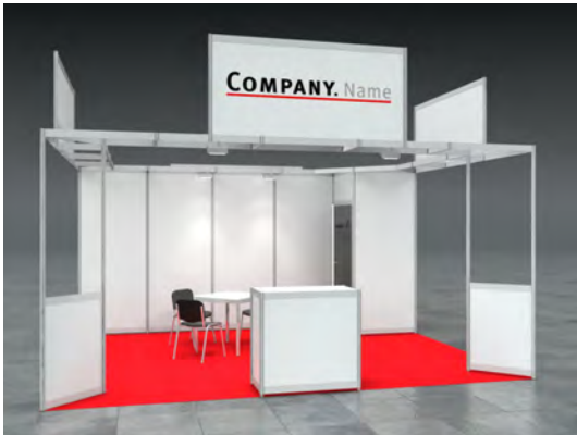
Beispiel: 20qm Kopfstand