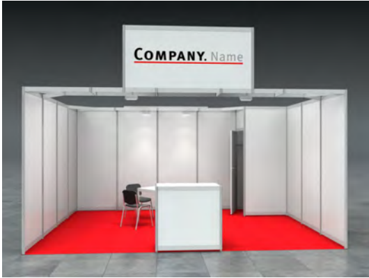
Beispiel: 20qm Reihenstand

Wir bestellen den Mietmessestand SAM entsprechend unserer Standgröße.