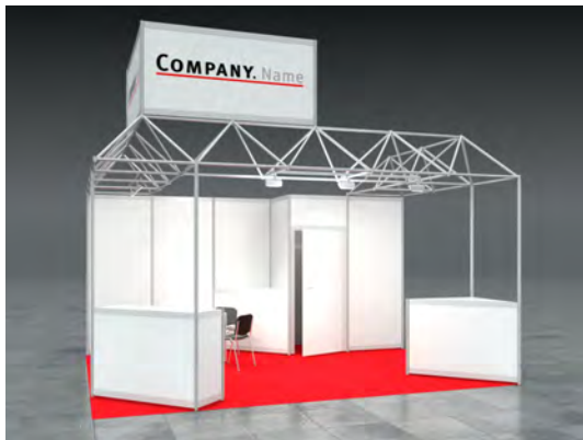
Beispiel: 20qm Kopfstand